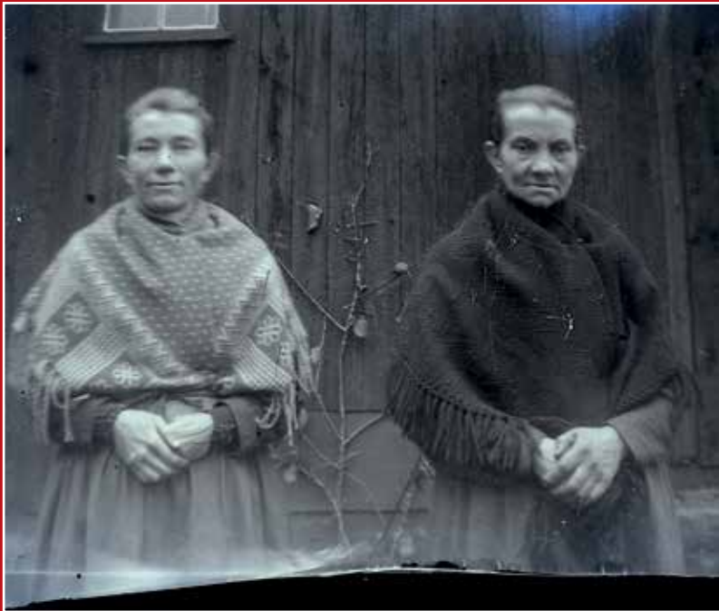
Twee Meerse vrouwen met traditionele Kempische sjaal rond 1900-1920.