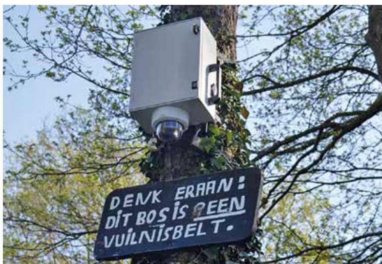
Uit veiligheidsoverwegingen tonen we hier een camera van een ander type dat in Hoogstraten wordt gebruikt

Niettegenstaande de positieve resultaten van de inzet van de sluikstortcamera, stellen we vast dat er in Hoogstraten veel sluikstorten blijven voorkomen. We kunnen de camera uiteraard niet op verschillende plaatsen tegelijk opstellen. Daarom is het schepencollege van plan om twee extra camera's aan te kopen. Op die manier kan de strijd tegen zwerfvuil en sluikstort nog efficiënter worden gevoerd.