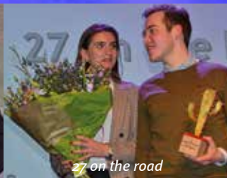
27 on the road