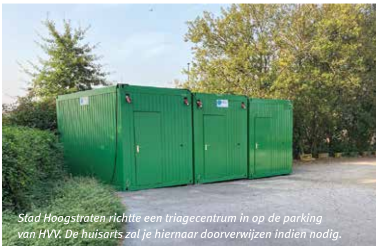
Stad Hoogstraten richtte een triagecentrum in op de parking van HVV. De huisarts zal je hiernaar doorverwijzen indien nodig.