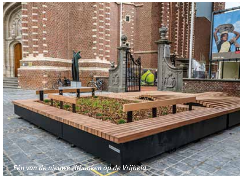
Eén van de nieuwe zitbanken op de Vrijheid.

Met het budget van dit project en de beperkte looptijd kon het hele verhaal rond de mobiliteit niet worden aangepakt. Maar we konden al wel kleinere aanpassingen doen. Zo koos de stad ervoor om onder andere twee grote zitbanken te plaatsen vlakbij de kerk. Deze zitbanken zijn opgebouwd volgens een modulair systeem en je kan er belevingseilanden mee samenstellen. Het is stevig materiaal dat geschikt is voor het gebruik in publieke ruimtes en het is vandalismebestendig.