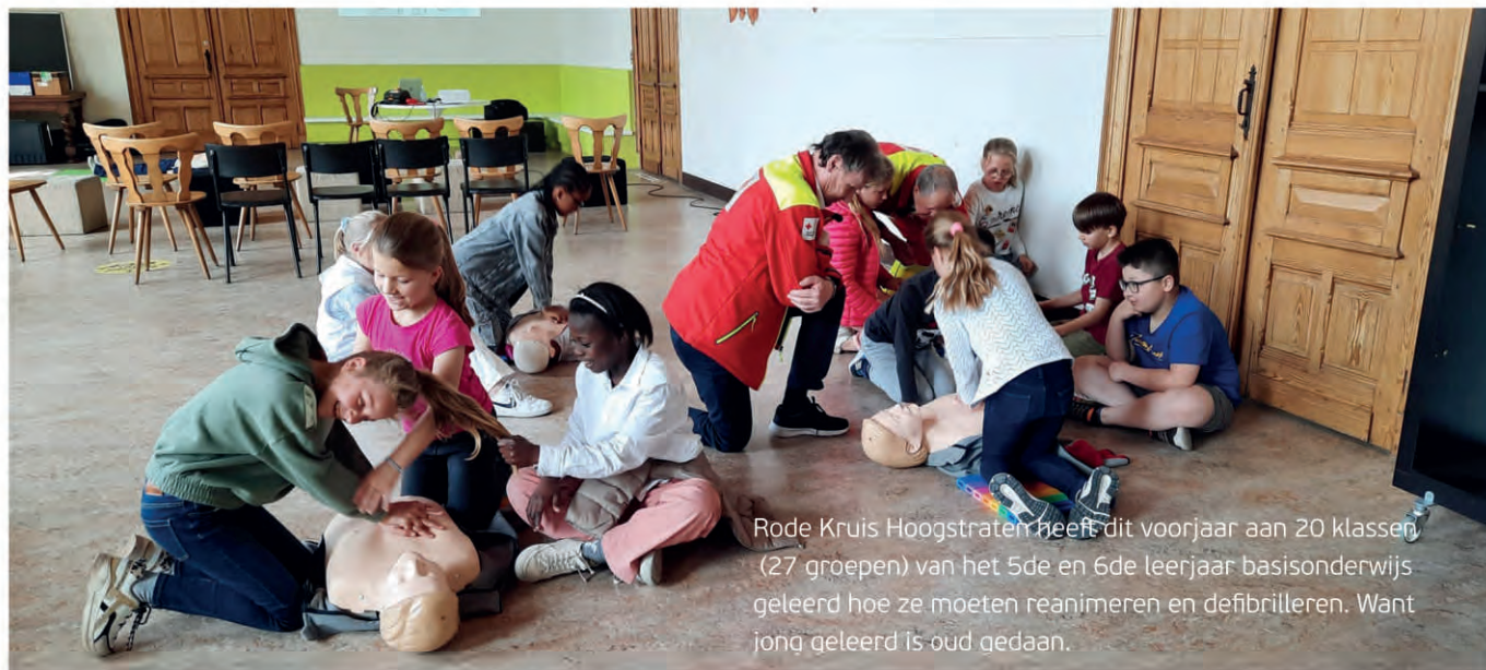
Rode Kruis Hoogstraten heeft dit voorjaar aan 20 klassen (27 groepen) van het 5de en 6de leerjaar basisonderwijs geleerd hoe ze moeten reanimeren en defibrilleren. Want jong geleerd is oud gedaan.

Sinds 1 maart 2017 kent stad Hoogstraten als eerste regio in België een systeem van burgerhulpverleners. Bij vermoeden van een hartstilstand, een elektrocutie of een verdrinking, stuurt de noodcentrale 112 niet enkel een ambulance en een MUG ter plaatse, maar roept ze ook getrainde burgers op om hulp te bieden in afwachting van de aankomst van de professionele hulpdiensten.