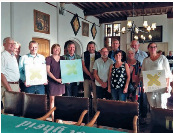
Het stadsbestuur ontving in juni de vereniging van Ouders van Verongelukte kinderen.

Als stadsbestuur willen we dat u als Hoogstratenaar voelt dat u tot een warme, aangename en veilige samenleving behoort. Verkeersveiligheid is daar een belangrijk onderdeel van en staat dan ook hoog op onze agenda. Elke ouder moet met een gerust hart zijn of haar kinderen kunnen uitwuiwen als ze te voet of met hun fiets het huis verlaten. Dat is een streefdoel dat we in Hoogstraten nooit los zullen laten. Straks begint het nieuwe schooljaar. Het lijkt mij nu dan ook het juiste moment om daar nog eens extra aandacht aan te besteden.