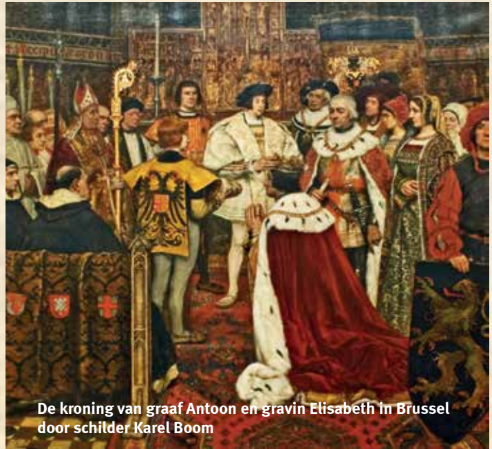
De kroning van graaf Antoon en gravin Elisabeth in Brussel door schilder Karel Boom