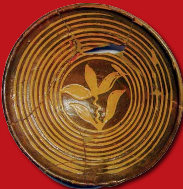
Een prachtig 17de eeuws bordje met slibversiering (archeologische vondst Begijnhof)

Elk jaar ontvangt het Stedelijk Museum Hoogstraten verschillende grote en kleine schenkingen. Soms geeft iemand een mooie oude foto van Hoogstraten, een oud doodsprentje, een archeologische vondst, een boek over Hoogstraten, enz. Deze schenkingen zijn belangrijk voor het museum. Het grootste deel van de collectie bestaat immers uit schenkingen.