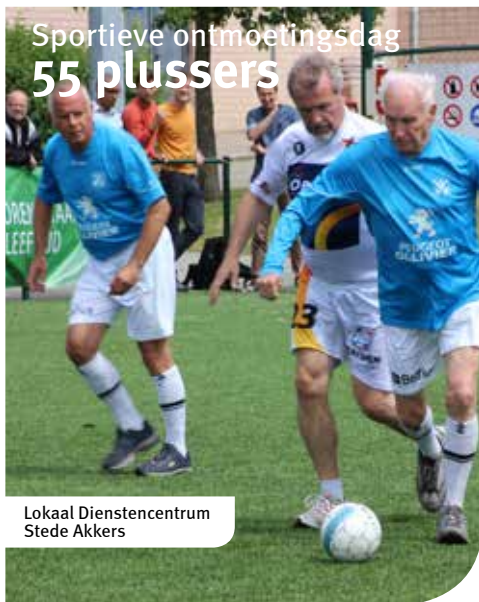
Lokaal Dienstencentrum Stede Akkers

Op donderdag 16 juni organiseert de sportdienst in samenwerking met de ouderenraad een sportieve ontmoetingsnamiddag voor 55+. Dit is een ideale gelegenheid om kennis te maken met verschillende beweegactiviteiten aangepast aan de leeftijd van 55-plussers. Voldoende bewegen is immers voor iedereen van belang, maar zeker als u 55+ bent!