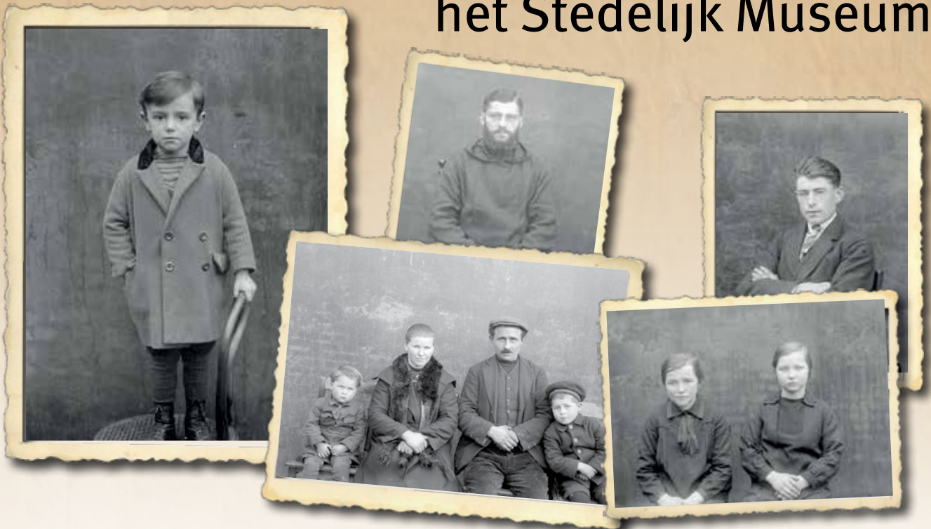
De glasnegatieven afkomstig van fotograaf Jos Hendrickx geven een beeld van de bevolking in Hoogstraten in de jaren dertig.

Elk jaar ontvangt het Stedelijk Museum Hoogstraten verschillende grote en kleine schenkingen. Soms geeft iemand een mooie oude foto van Hoogstraten, een oud bidprentje, een archeologische vondst, een boek over Hoogstraten,... Deze schenkingen zijn belangrijk voor het museum. Het grootste deel van hun collectie bestaat immers uit schenkingen.