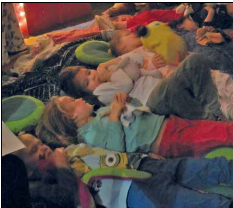
Tijdens het pyjamalezen in de BiB voeren de kleinsten onder ons opdrachten uit rond het slaapritueel.